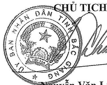
Nguyễn Văn Linh