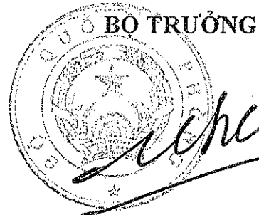
Đại tướng Ngô Xuân Lịch