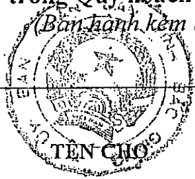
Biểu 1. Tổng hợp danh sách các chợ được điều chỉnh, bổ sung trong Quy hoạch mạng lưới chợ, trung tâm thương mại và siêu thị tỉnh Bắc Giang đến năm 2020 (Ban hành kèm theo Quyết định số 513 /QĐ-UBND ngày 30/12/2011 của UBND tỉnh Bắc Giang)