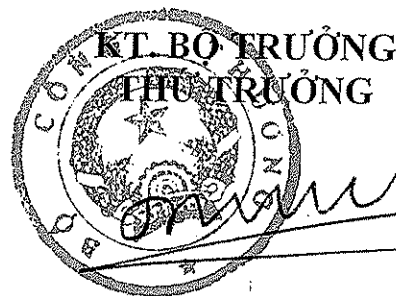
Đỗ Thăng Hải